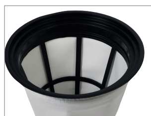
SANIFILTER - FILTRO CON TRATTAMENTO ANTIBATTERICO