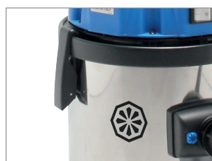
GANCI ALTAMENTE RESISTENTI