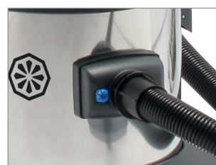
ROBUSTO FUSTO IN ACCIAIO

I dati relativi a depressione e aria aspirata si riferiscono ai singoli motori. Dati, descrizioni e illustrazioni sono forniti a titolo indicativo: la ditta si riserva di modificarli senza preavviso.