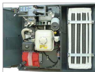
FILTRO IN TESSUTO