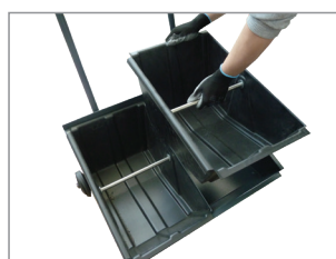
CONTENITORE PER RIFIUTI DI GRANDE CAPACITÀ