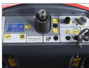
PANNELLO DI CONTROLLO INTUITIVO