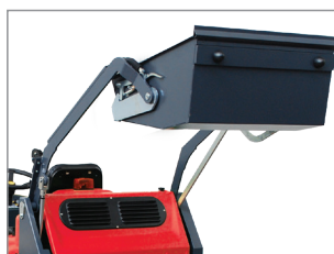
SISTEMA DI SCARICO CON PISTONE IDRAULICO